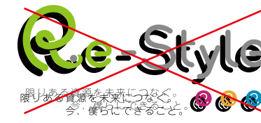
ドロップシャドウ