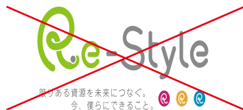
縦横の比率の変更・変形 (長体・平体・斜体)