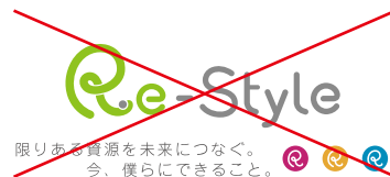
ロゴとコピーの比率の変更