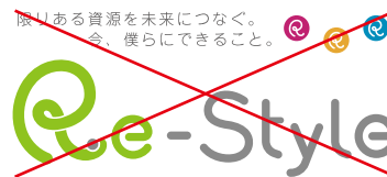
要素の配置の変更