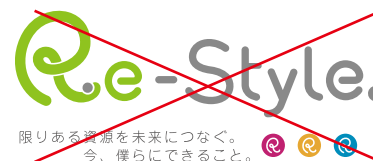
不可侵範囲内に要素の追加